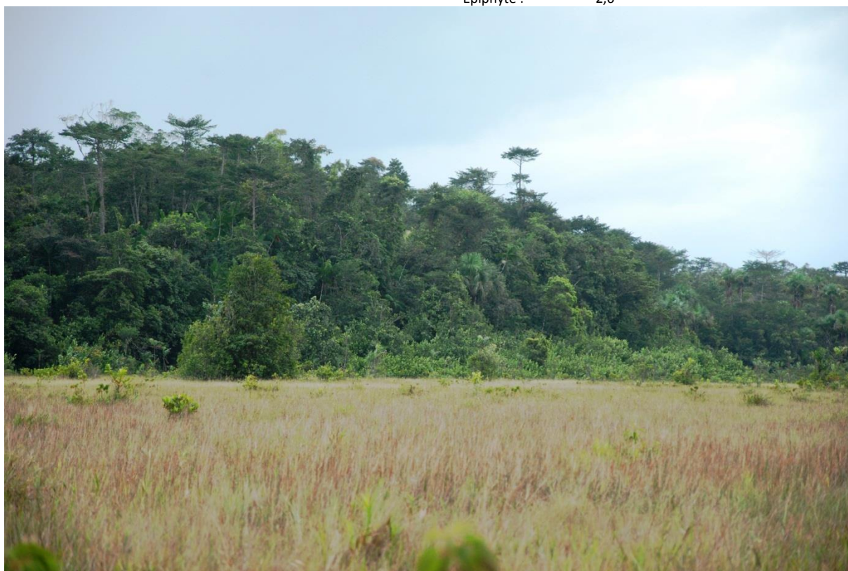
Grand îlot forestier sur sol inondable. Les arbres légèrement émergents dont la couronne est étagée sont des Symphonia globulifera , espèce dominante de cette forêt. Savane incluse de Nancibo, avril 2011.

Description : Massifs forestiers isolés au sein des savanes inondables, développés sur un sol marécageux ou inondable. La canopée est généralement élevée, et dépasse généralement les 15 m. Le sous-bois est sombre et humide, bien caractérisé. Ces îlots forestiers, malgré leur situation isolée en savane, ne semblent pas différer significativement des forêts marécageuses à Symphonia typiques : ils sont également dominés par l'association de deux grands arbres - Virola surinamensis et Symphonia globulifera .