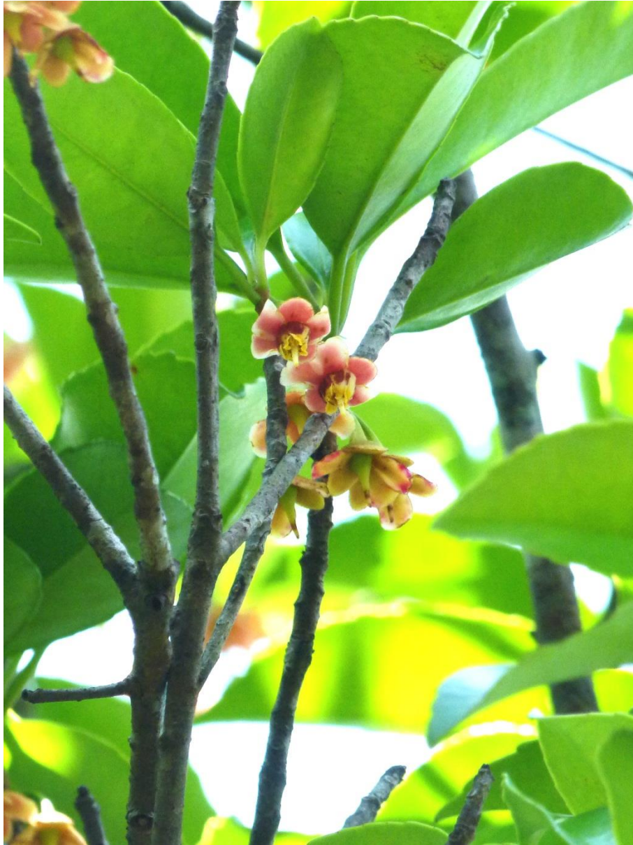
Ternstroemia dentata (Pentaphylacaceae). Cet arbuste inféodé aux savanes sur sables blancs disparaît dès que le régime d'incendie est trop fort. Particulièrement menacé, nous n'avons trouvé, durant cette étude, que deux populations relictuelles comprenant chacune une poignée d'individus. Ses fleurs éphémères ont été photographiées en septembre 2011 dans la savane isolée et encore intacte de Terres blanches, où il est encore abondant.