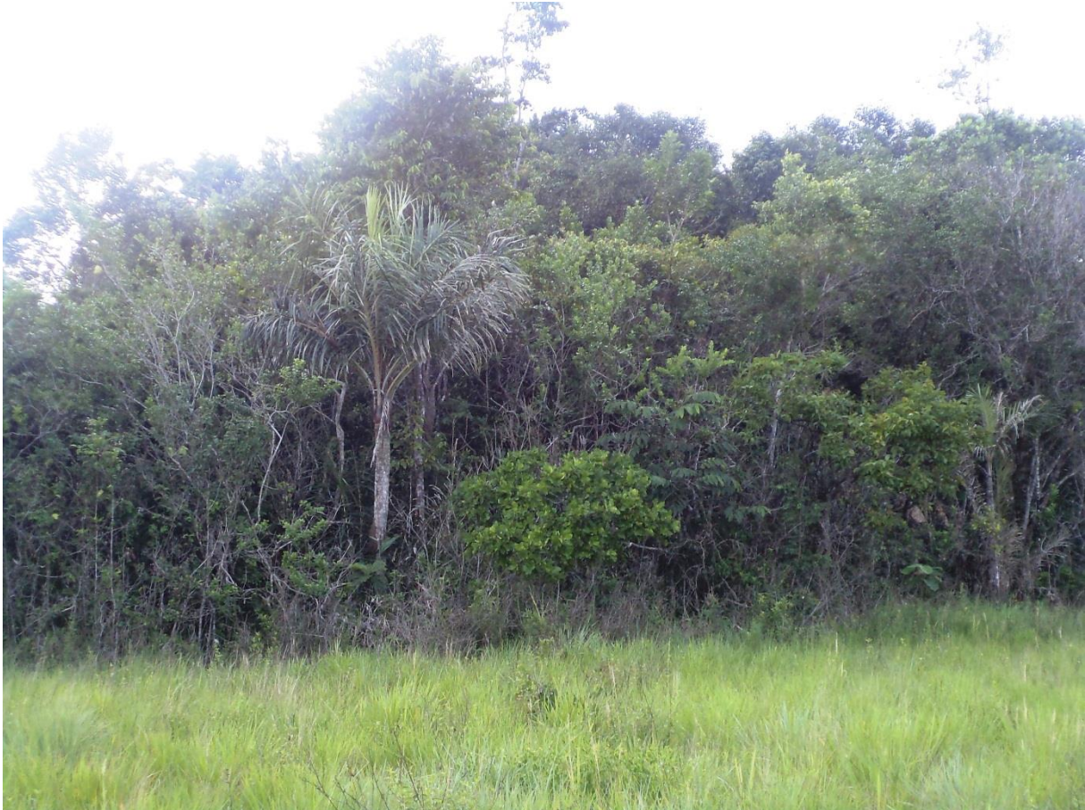
Ilot forestier perché au sommet d'une petite colline, ceinturé d'une savane sèche à Trachypogon (3.1.3). Savane Garré-Rochéau, janvier 2012.

Description : Massifs forestiers isolés au sein des savanes sèches, à sol globalement bien drainé. La canopée reste basse pour une formation forestière, n'atteignant qu'exceptionnellement 20 m de haut (plus souvent seulement 8-12 m). Le sous-bois est sombre et bien caractérisé, sa végétation éparse. En revanche ses lisières sont bien éclairées et hébergent un cortège riche d'espèces héliophiles (petits arbres, arbustes et herbacées). Les lianes ligneuses deviennent fréquentes.