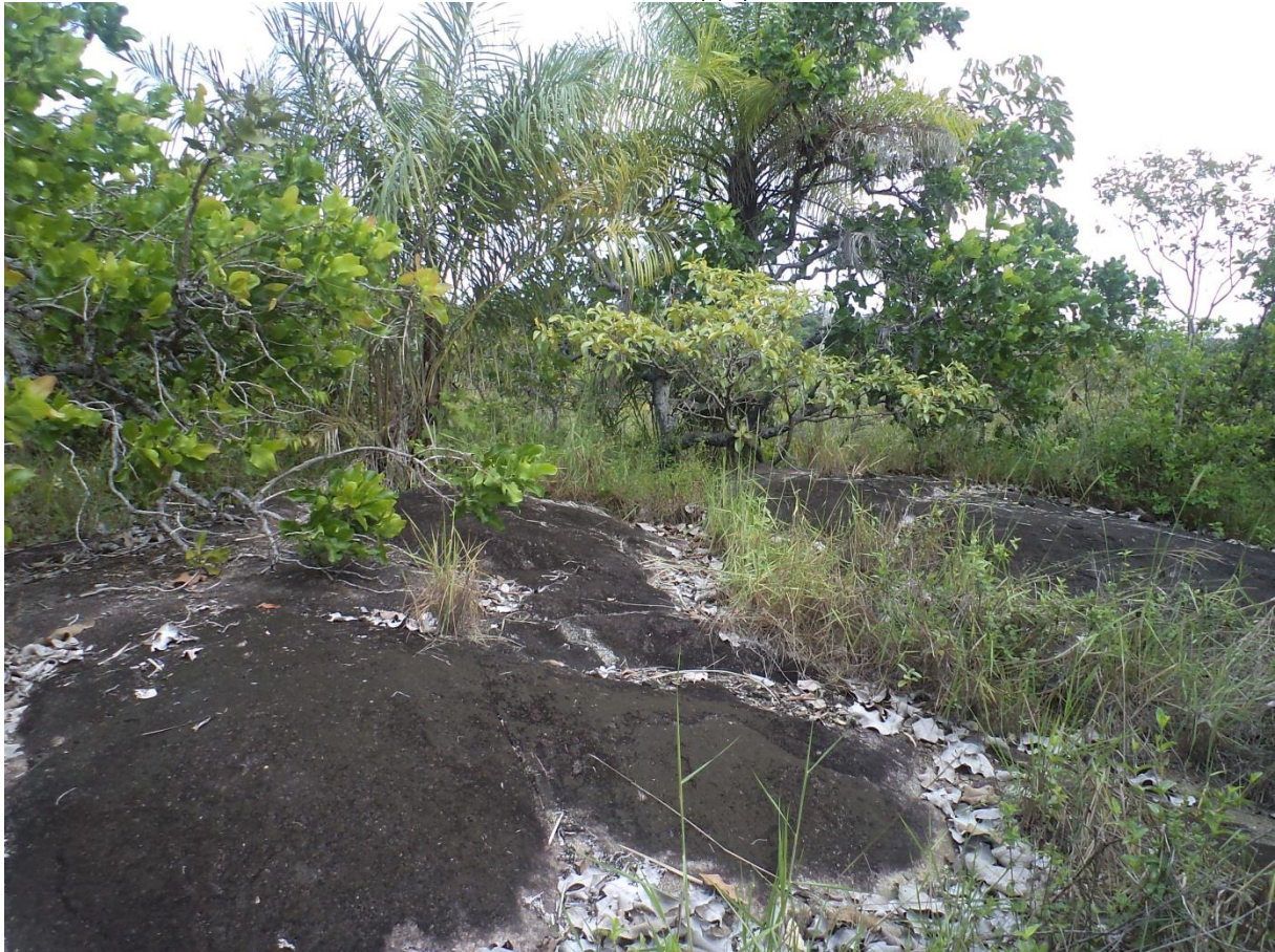
Rochers émergeant de la savane. Notez la diversité de la végétation de la savane-roche et de ses lisières. Savanne Renner, décembre 2012.

Description : les dalles et môles rocheux émergents des savanes supportent une flore très diversifiée mais caractéristique. Le modelé de la roche conditionne l'épaisseur du sol et en retour la végétation qui s'y développe. La surface de la roche est recouverte d'un fin film noir de cyanobactéries ; les conditions édaphiques qui règnent sont extrêmes. Dans les petites dépressions s'accumulent des petits gravillons et une petite couche d'humus peut se former, supportant une flore aussi caractéristique que rare. Aux endroits plus favorables, un vrai sol se développe et la végétation se diversifie tout en restant caractéristique. Les lisières des savanes-roches sont généralement bien différenciées de la savane environnante. La taille et de la forme (plate ou en dôme) des roches affleurantes conditionnent une diversité paysagère importante : d'un site à l'autre la flore peut être bien différente (en dehors du fond commun constitué des espèces les plus adaptées).