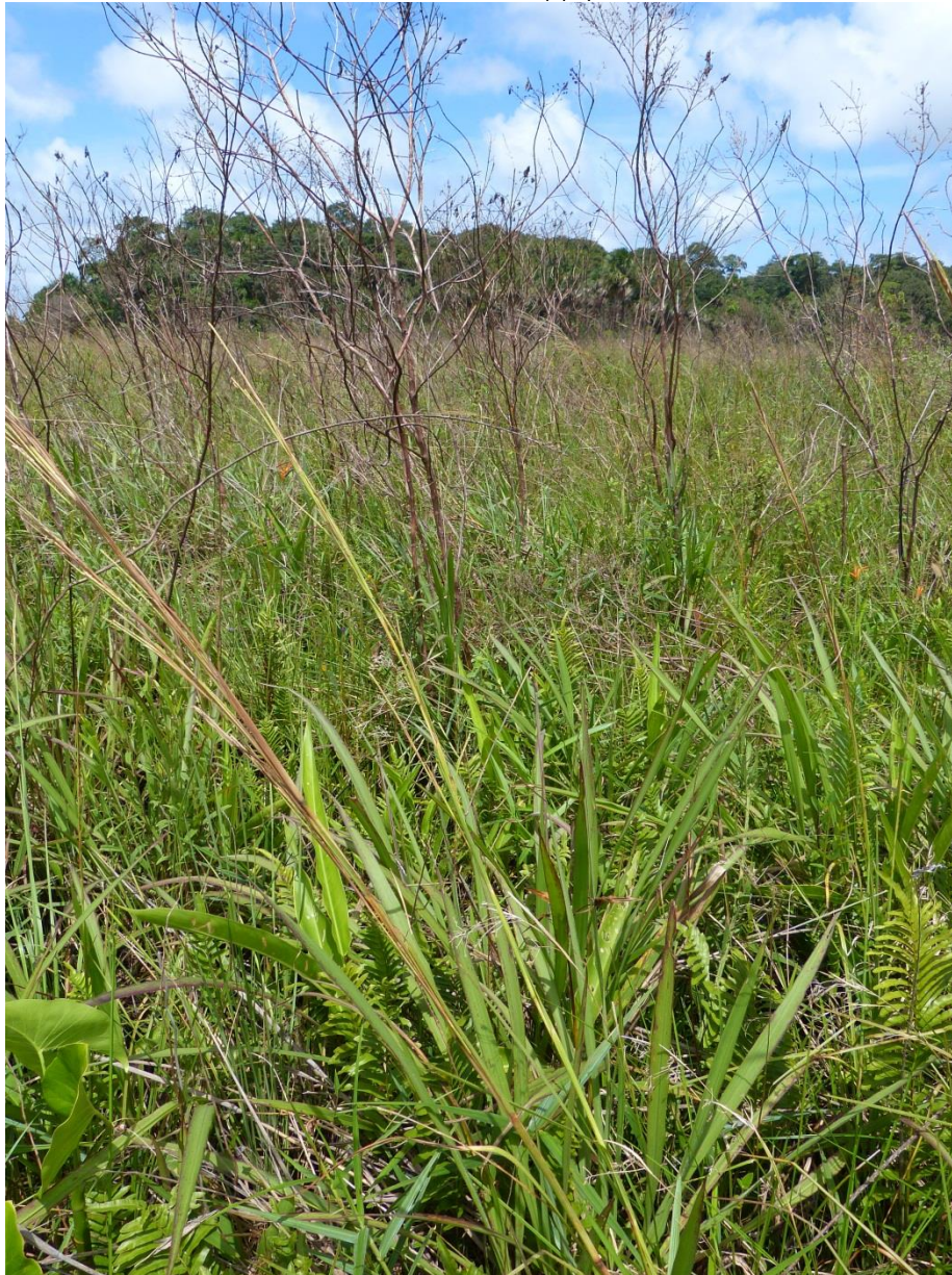
Un bas-fond à buttes bien caractérisé. Trou-poisson février 2012.

Description : les bas-fonds à buttes se distinguent avant tout par la présence de « champs de buttes ». La végétation occupant la partie supérieure des buttes est haute et dominée par des herbacées mais comprend en sus de nombreux éléments ligneux (buissons à petits arbres) et de nombreuses lianes herbacées. Cette végétation forme une strate supérieure qui abrite de la lumière du soleil une strate inférieure sciaphile et hygrophile, composée de plantes de petite taille se développant dans les chenaux ménagés entre les buttes. La stratification de la végétation liée à la complexité du micro-relief est caractéristique de ces bas-fonds à buttes. Le mécanisme naturel conduisant au développement de ces systèmes buttes-chenaux reste mal connu, mais leur évolution semble fortement conditionnée par l'encassement en vallon du bas-fond. Notons toutefois que des formations tout à fait similaires sont d'origine artificielle, ce sont les champs de buttes amérindiens. Ils supportent le même type de végétation. On retrouve encore ces formations à buttes en ceintures autour des mares naturelles et des prpriis à Eleocharis et enfin de manière très fréquente en situation d'écotone forêt-savane. La diversité