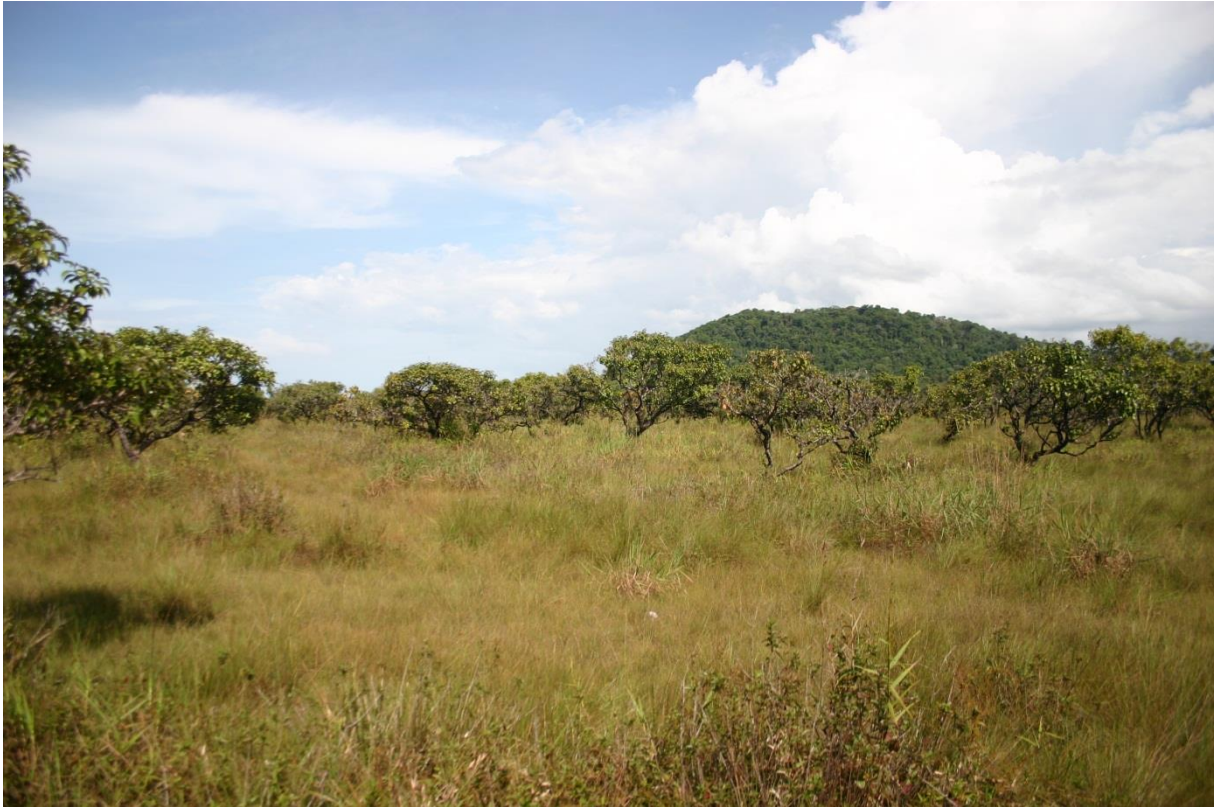
Paysage de savane sur sol hydromorphe, typique de la frange la plus proche du littoral. L'imbrication étroite des pelouses rases (3.2.2.1), savanes moyennement haute (3.2.2.2) et des buttes (3.1.3) qui la parsèment rend parfois confuse la distinction de cet ensemble avec la savane haute arbustive (3.3). Savane des Pères de Kourou, août 2011.