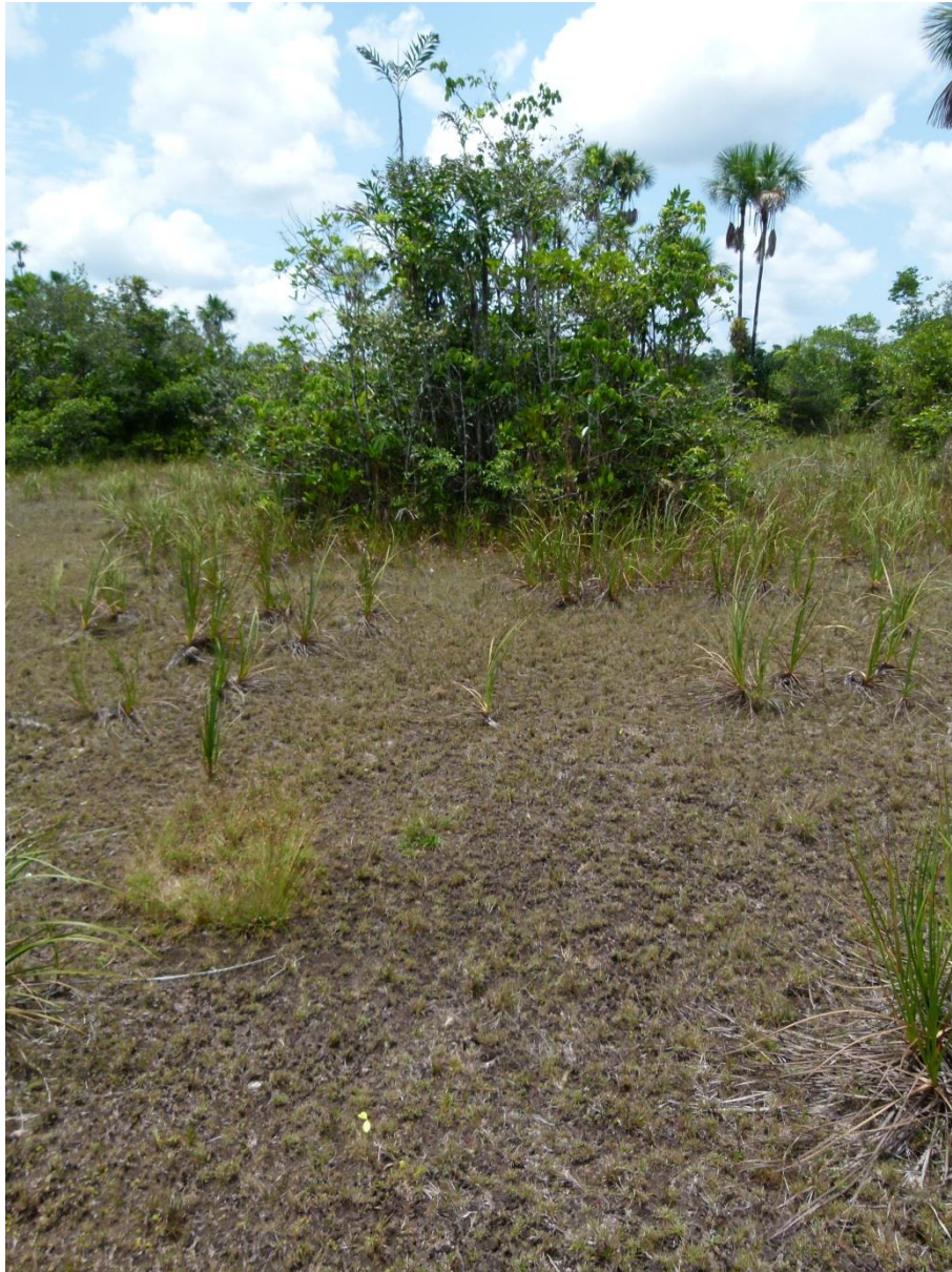
Aspect typique d'un petit bosquet sur sables blancs à Ternstroemia dentata , Cybianthus fulvopulverulentus et Bactris campestris . Savanes incluses de Nancibo, septembre 2011.

Description : petits bosquets de savane de faible hauteur, se développant en savane sur sables blancs, sur un sol surélevé en plateau ou en butte (selon la taille du bosquet). Les arbustes et petits arbres qui le composent sont souvent sclérophylles. Selon le régime hydrique, on note deux faciès bien différents. Dans les régions arrosées ou les zones basses le petit palmier épineux Bactris campestris devient