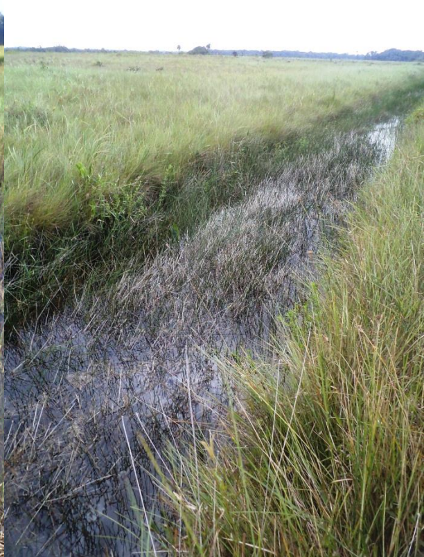
b) Fossé de drainage. Trou-Poisson, décembre 2011

Description : si les mares d'origine naturelles sont assez peu fréquentes, en revanche les mares d'origine anthropique et les fossés constituent des éléments récurrents des paysages de savanes. Leur régime hydrique est variable mais en général les mares et fossés s'assèchent temporairement en saison sèche. C'est pendant la période d'assèchement que la végétation est la plus dynamique. Plusieurs espèces rares sont strictement inféodées à ce biotope. La biodiversité des mares temporaires naturelles nous est apparue plus diversifiée et bien plus riche en espèces rares que celle des mares et fossés d'origine anthropique dont les bords généralement abrupts limitent la diversité des conditions édaphiques. De ce point de vue les mares naturelles de la savane sur sables blancs de Trou-Poisson sont remarquables.