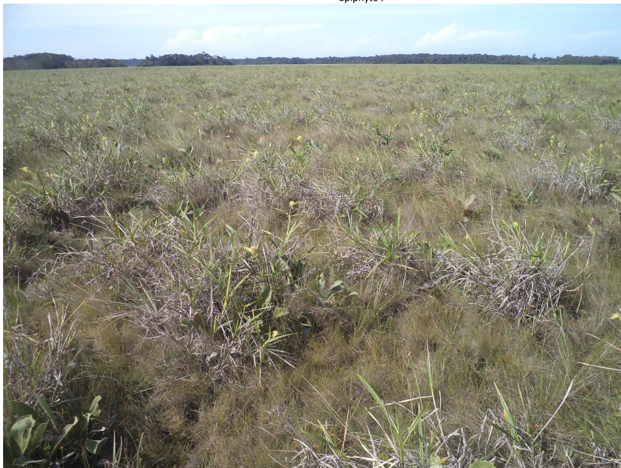
Aspect typique de l'association à Scleria cyperina (pompons blanchâtres) et Tibouchina aspera . On aperçoit en bas à gauche les feuilles en oreilles d'ânes du Byrsonima verbascifolia . Trou-poisson, décembre 2011.

Description : cet habitat partage de nombreuses caractéristiques avec les savanes sèches à Trachypogon (3.1.1). Elles en diffèrent par la dominance de l'association Scleria cyperina-Tibouchina aspera . Par ailleurs, le couvert végétal est moins dense et moins élevé, et des petites plages de pelouses rases apparaissent fréquemment.