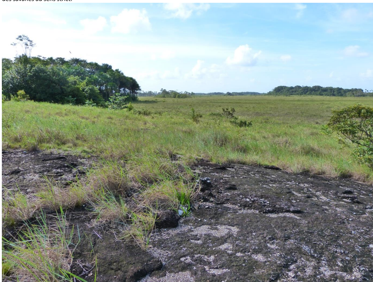
Roche Corbeau, savane Garré, février 2012.

lumière notre choix de ne pas subdiviser cette unité paysagère lors des relevés ; ce choix a été guidé par les objectifs de ce travail : l'étude des savanes au sens strict.