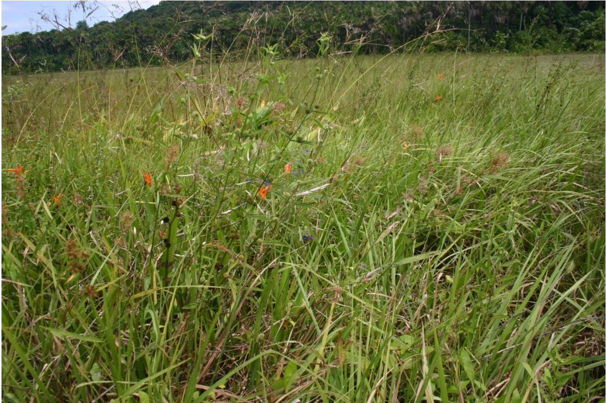
Bas-fonds à buttes : remarquez la diversité de la végétation -tant spécifique que structurelle - si caractéristique de cet habitat de savane. Savane des Pères de Kourou, août 2011.