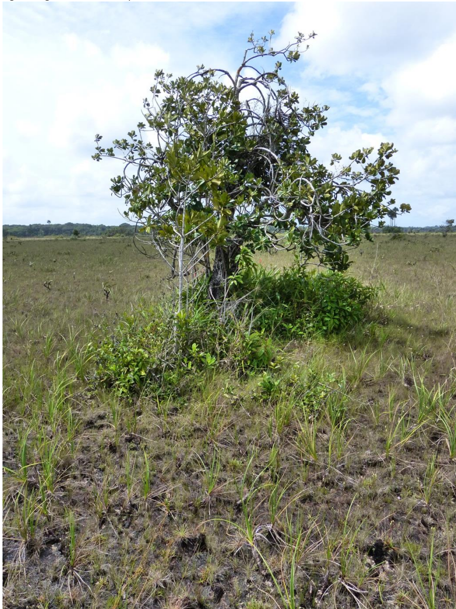
Fragment relictuel de bosquet sur sables blancs. La forme torturée du Cybianthus fulvopulverulentus et les Tillandsia flexuosa épiphytes qu'il supporte sont caractéristiques. Savane de Trou-Poisson, février 2012.

Liens avec les autres habitats : sur l'AFC, le nuage de points des petits bosquets de savanes sur sables blancs occupe une position très excentrée qui souligne l'originalité de ce biotope, tout comme celle des autres formations des savanes sur sables blancs.