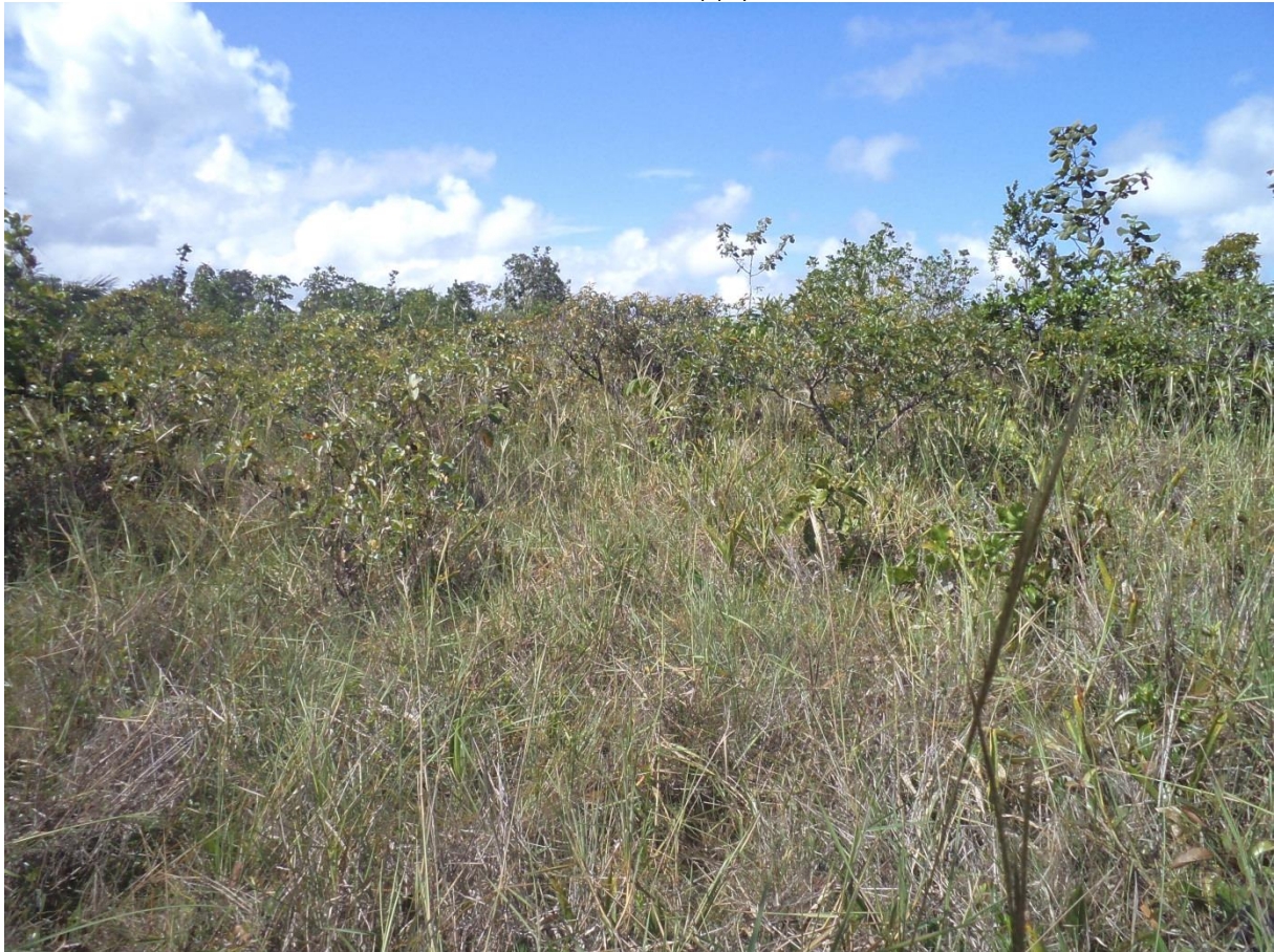
Faciès typique de la savane haute arbustive. Savane Renner, décembre 2011.

Description : formation de savane à strate arbustive généralement bien développée (ca. 3-6 m de haut), dominant une strate moyenne très diversifiée (1-2 m de haut), comprenant de nombreux éléments ligneux noyés dans un couvert herbacée dense, elle-même dominant souvent une strate inférieure herbacée. Le sol est marqué par un micro-relief bien développé avec de nombreuses buttes ménageant entre elles des chenaux restant longtemps en eau. Cet habitat de savane est unique par sa stratification, il constitue une sorte d'intermédiaire avec les bosquets de savane. De nombreux auteurs pensent que cette formation correspond aux premiers stades de recolonisation de la savane par la forêt –recolonisation mise en lien avec la faible fréquence des incendies-, mais les arguments solides manquent pour étayer cette hypothèse. Nos observations de terrain nous laissent penser que cet habitat pourrait en fait être lié à la nature du sol.