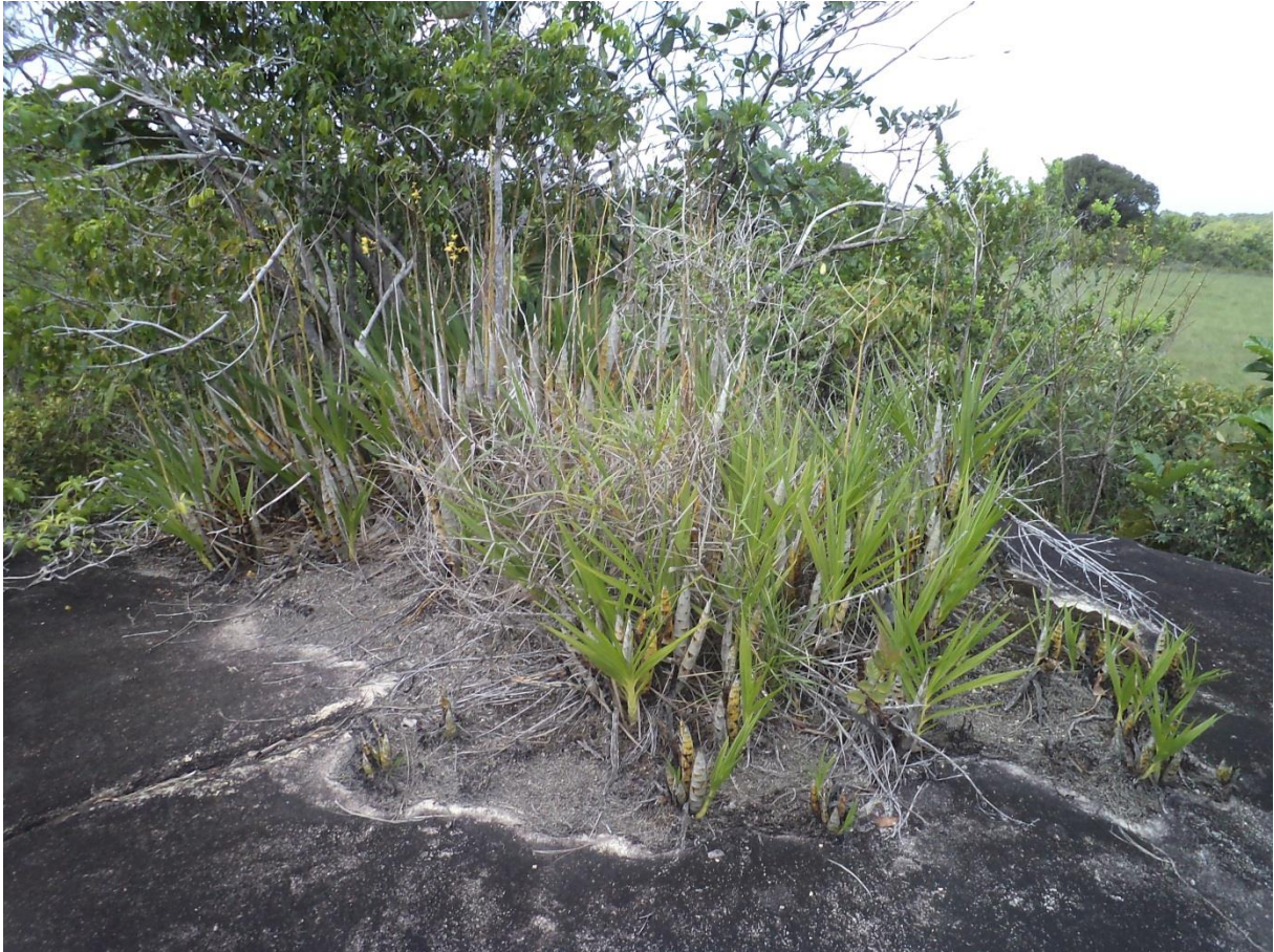
Les savanes roches réservent souvent de bonnes surprises au botaniste. Ici c'est une petite population de l'orchidée protégée Cyrtopodium andersonii . Inféodée aux inselbergs de l'intérieur du territoire, c'est avec grand plaisir que nous avons découvert ce jour là la première population littorale de cette espèce prisée des collectionneurs. Petit rocher en dôme émergeant à 1,5 m au-dessus du niveau de la savane, savane Renner, décembre 2011.