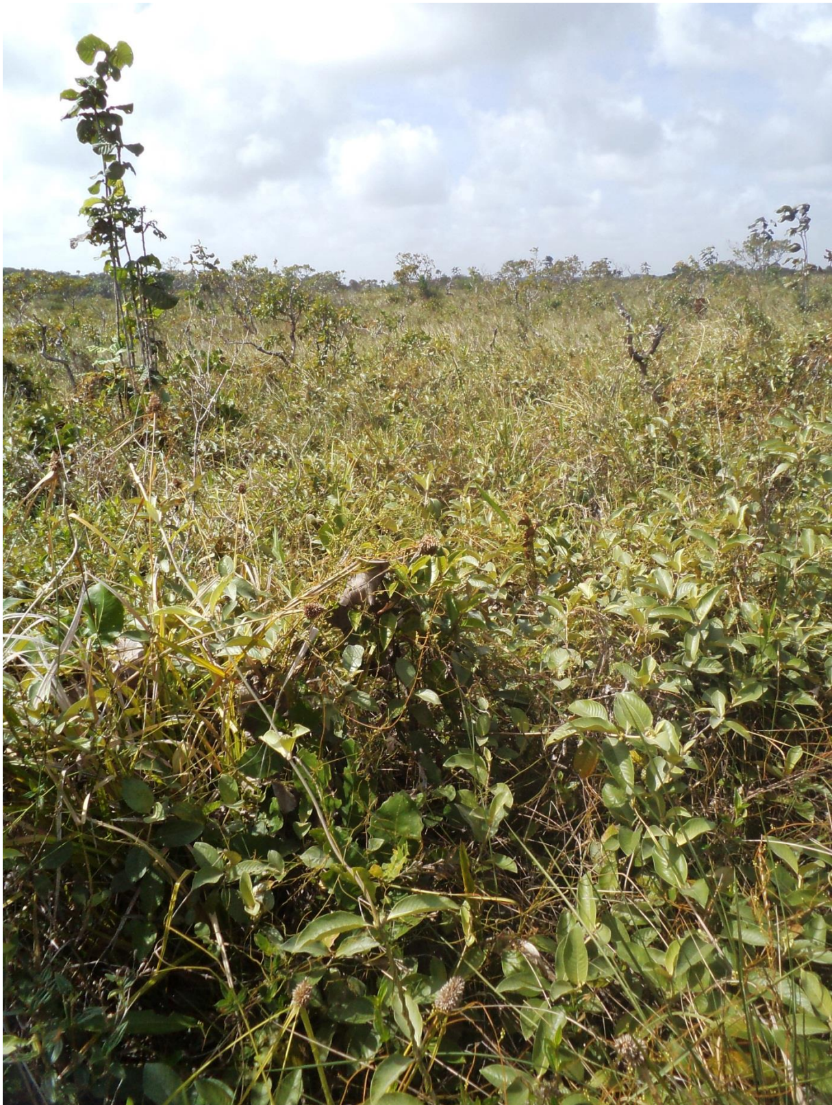
Savane haute arbustive, Corossouy, janvier 2012.