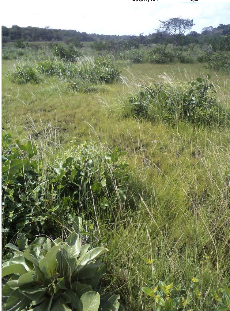
Petites buttes exondées émergeant d'une matrice de savane basse sur sol inondable. Ces buttes supportent les rares petits arbres et l'ensemble des petits arbustes de cette savane. Canceler, décembre 2011.

Description et identification : petites buttes de 20 à 50 cm de haut et de moins d'1 m 2 de surface parsemant les savanes inondables. Leur relief entraîne un régime hydrique radicalement différent de celui de la matrice qui l'entoure et la flore qui s'y développe est ainsi totalement différenciée. Dans les savanes inondables l'ensemble des végétaux ligneux (arbres, arbustes) ne poussent que sur les buttes. Comme pour les buttes des bas-fonds (2.2) leur origine n'est pas claire, mais il est possible qu'elles se soient formées sur des pas de temps très longs au pied des arbres par le travail des « ingénieurs du sol » (fourmis, termites,...), qui contribuent aujourd'hui à leur entretien.