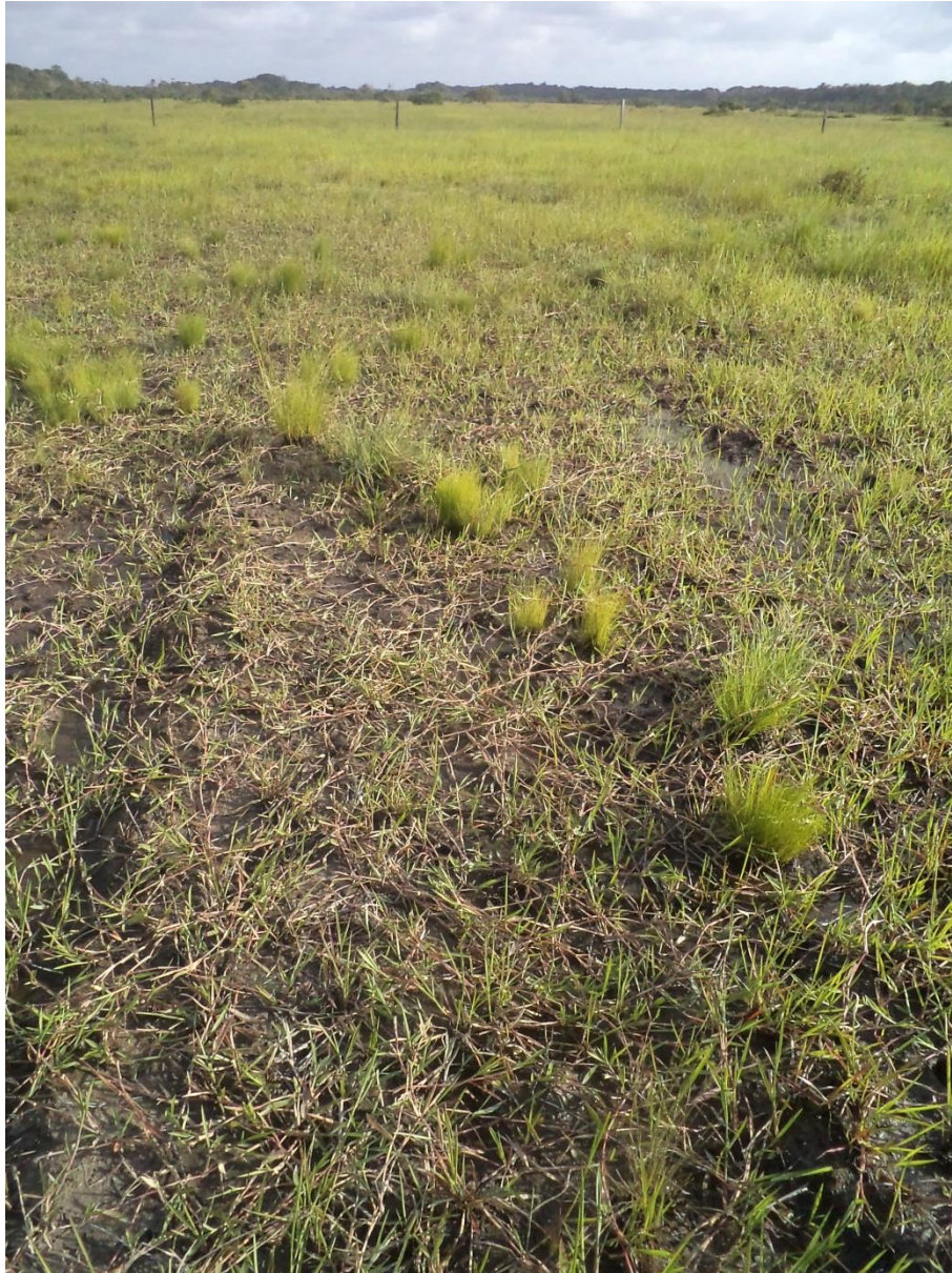
Une savane récemment convertie en pâturage : en 2006 le sol a été légèrement travaillé mécaniquement (disqueuse), puis planté de quelques boutures de Kikouyou ( Brachiaria humidicola ), le pâturage (ovin, caprin, bovin) augmente depuis progressivement avec l'amélioration de la pâture. Observez le dynamisme de quelques espèces dans cet écosystème récemment modifié et non encore à l'équilibre. Brigandin, janvier 2012.

Au cours de ce travail nous avons pu effectuer 41 relevés dans des milieux de savane lourdement impactés par l'homme. 385 espèces y ont été détectés, et 70 d'entre elles n'ont pas été retrouvées dans les milieux non ou faiblement anthropisés (voir liste ci-dessous). Par ailleurs sur les 762 espèces inventoriées durant cette étude nous avons compté 88 espèces exogènes (espèces n'existant pas à l'état naturel en Guyane) et donc liées à la présence de l'homme (voir également la liste ci-dessous). Afin de faciliter le travail d'identification des formations perturbées par l'impact humain, nous présentons ces deux listes d'espèces ci-dessous. Par ailleurs, nous avons établi une liste de 13 espèces indicatrices de la dégradation des savanes (cf. 6.B) et avons déjà expliqué comment leur présence pouvait renseigner sur la probabilité d'être dans un habitat fortement anthropisé. La liste de ces espèces est également rappelée ci-dessous et deux planches photographiques sont présentées afin d'aider à leur identification.