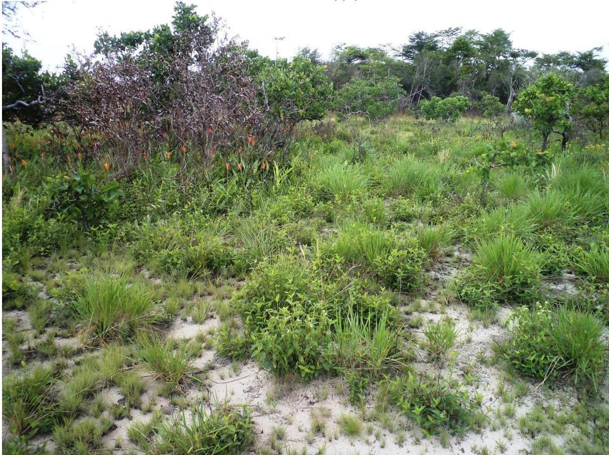
La savane sur sables de cheniers montre une végétation parfois très dénudée et xérophile aux endroits où s'accumulent les sables grossiers. Brigandin, janvier 2012.

Description : les cheniers sont des cordons sableux témoins d'anciennes dunes côtières. Ces cordons forment des séries de barres surélevées et parallèles au trait de côtes. Cet habitat partage les caractéristiques édaphiques générales des autres savanes sèches mais en diffère par son substrat constitué de sables grossiers très filtrants imprimant un caractère xérique sans doute encore plus marqué. Ces cordons sableux ont semble-t-il été des lieux d'installation privilégiés pour l'homme dans le passé. Il est possible que l'empreinte humaine se retrouve encore dans la végétation actuelle. En effet cette végétation est très diversifiée et comprend de nombreuses espèces rares qui pourraient avoir été liées à l'homme. Il est toutefois probable que cette diversité tire son origine de la diversité des micro-habitats, elle-même liée aux remaniements mécaniques du terrain.