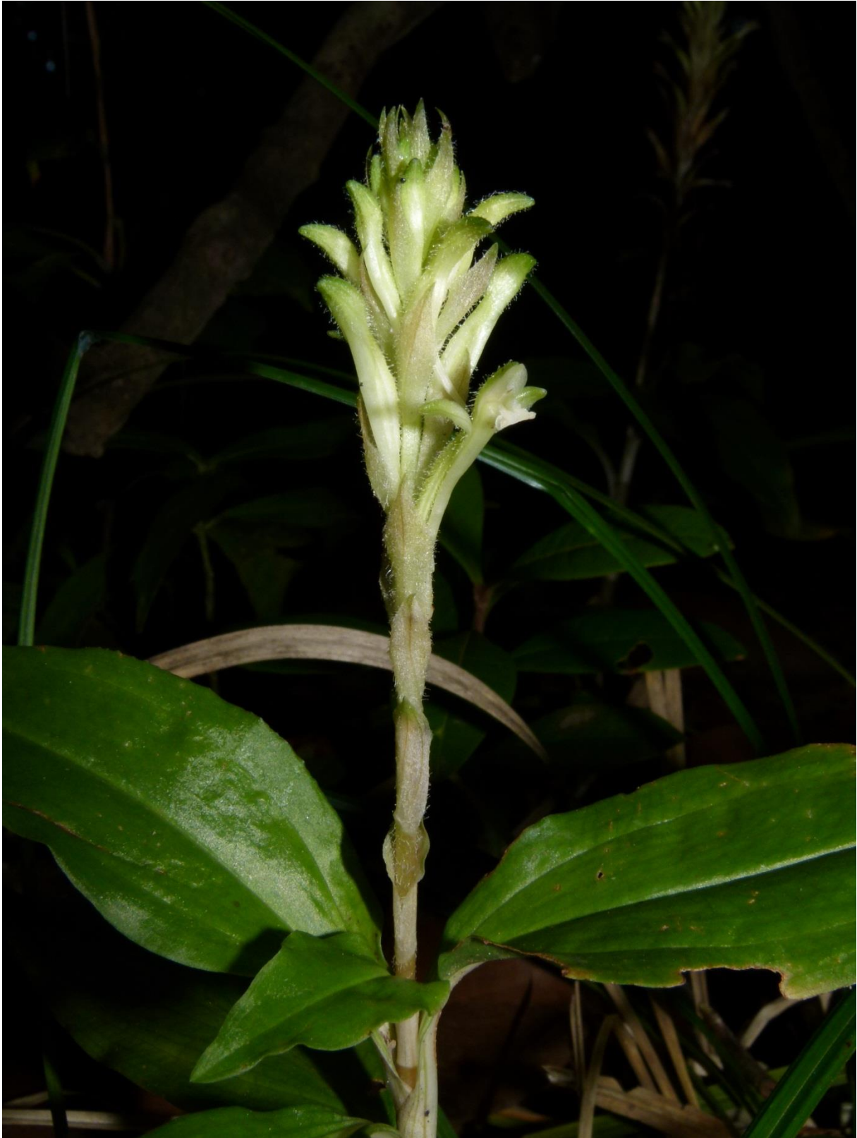
Aspidogyne longicornu (Orchidaceae). Cette petite orchidée terrestre, découverte en Guyane en 2010 seulement, semble strictement inféodée aux plus petits îlots forestiers sur sol marécageux, où elle se localise sur les lisières semi-ombragées. Suite à la découverte initiale, des prospections ciblées sur ces petits îlots forestiers et au moment de sa floraison ont permis de mettre en évidence sa présence sur trois autres sites distants de plusieurs dizaines de kilomètres. Pripris Maillard, le 04 août 2011.