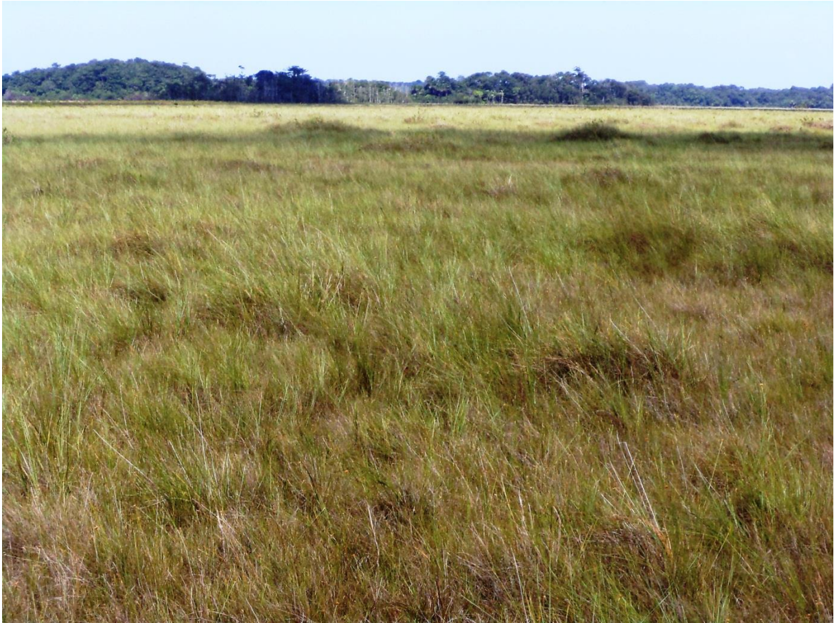
Savane moyennement haute sur sol hydromorphe, en formation pure. Savane de Trou-Poisson, décembre 2011.