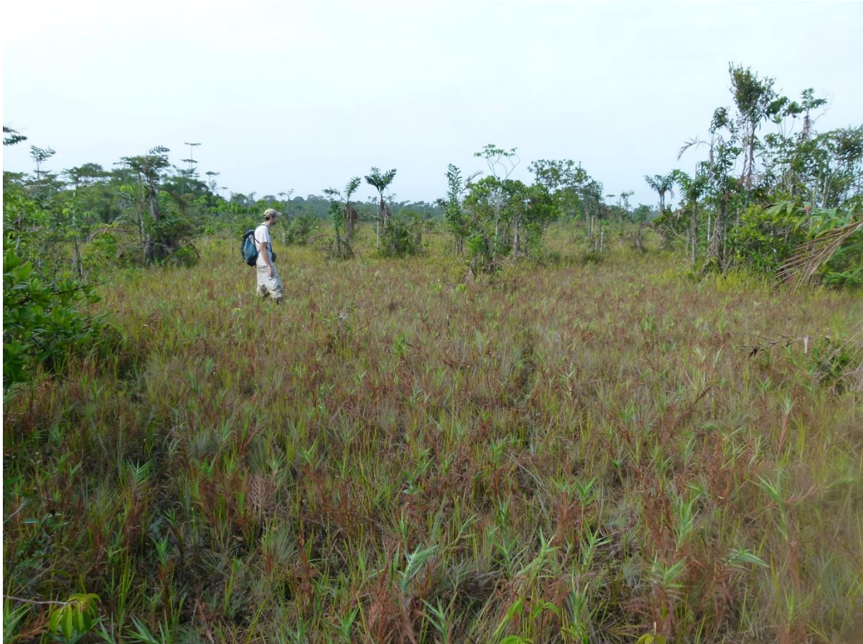
Savane moyennement haute sur sables blancs. Les herbes d'un vert bleuté à feuilles distiques sont celles du Panicum nervosum , graminée dominant cette formation. Nancibo, septembre 2011.

Description : formation herbacée moyennement haute (30-50 cm) dominée par une graminée - Panicum nervosum , inondée pendant la saison des pluies, et se développant sur des sables blancs. Ce type de savane colonise parfois de vastes espaces, mais on le rencontre plus souvent sous forme de corridors le long de petits bas-fonds ou encore en lisière forêt-savane.