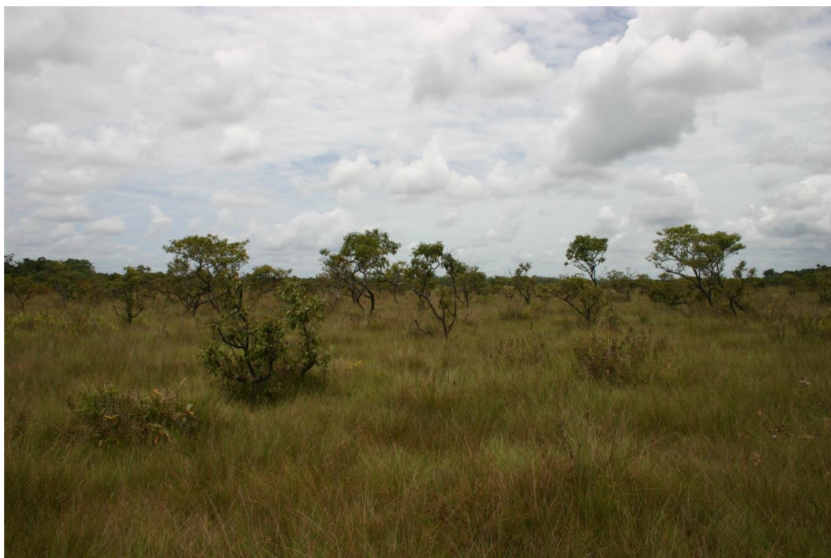
Paysage typique de savane sur sol hydromorphe : savane moyennement haute (3.2.2.2) modelée de buttes (3.1.3) desquelles émergent Byrsonima crassifolia et Curatella americana . Savane des Pères, septembre 2011.

caractéristiques édaphiques en partie similaires. Deux relevés apparaissent nettement différenciés des autres et se positionnent parmi les relevés de bosquets sur sables blancs. Cette erreur d'identification met en exergue la différence quantitative existant entre ces deux habitats : les buttes occupent de plus faibles superficies que les petits bosquets et montrent que de rares intermédiaires existent entre les deux.