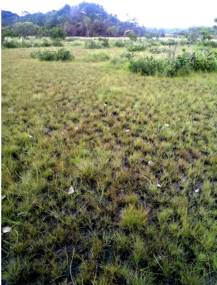
Pelouse rase sur sol hydromorphe. Notez l'aspect sombre du sol par rapport aux pelouses sur sables blancs. Canceler, janvier 2012.

Description : formation de pelouses rases (hauteur 5-15 cm), se développant sur des sols hydromorphes noirs en surface, longuement inondées pendant la saison des pluies et une partie de la saison sèche, s'assèchant ensuite durant quelques semaines à partir de mi-septembre et jusqu'au retour des pluies en décembre. Cette pelouse forme généralement une matrice plane de laquelle émergent des buttes éparées supportant une flore parfaitement différenciée (3.1.3). Les cypéracées et dans une moindre mesure les graminées dominent très largement la végétation qui offre ainsi une diversité structurelle quasi inexistante.