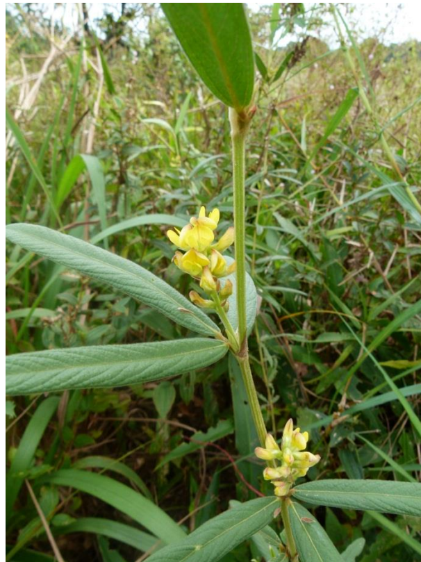
Eriosema violacea était une espèce considérée comme très rare jusqu'à récemment. Elle est en réalité plus fréquente qu'on ne le pensait et est strictement inféodée aux bas-fonds à buttes. Savanes des Pères de Kourou, août 2012.