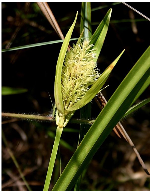
Scleria cyperina , Cypéracées dominante de cette formation.