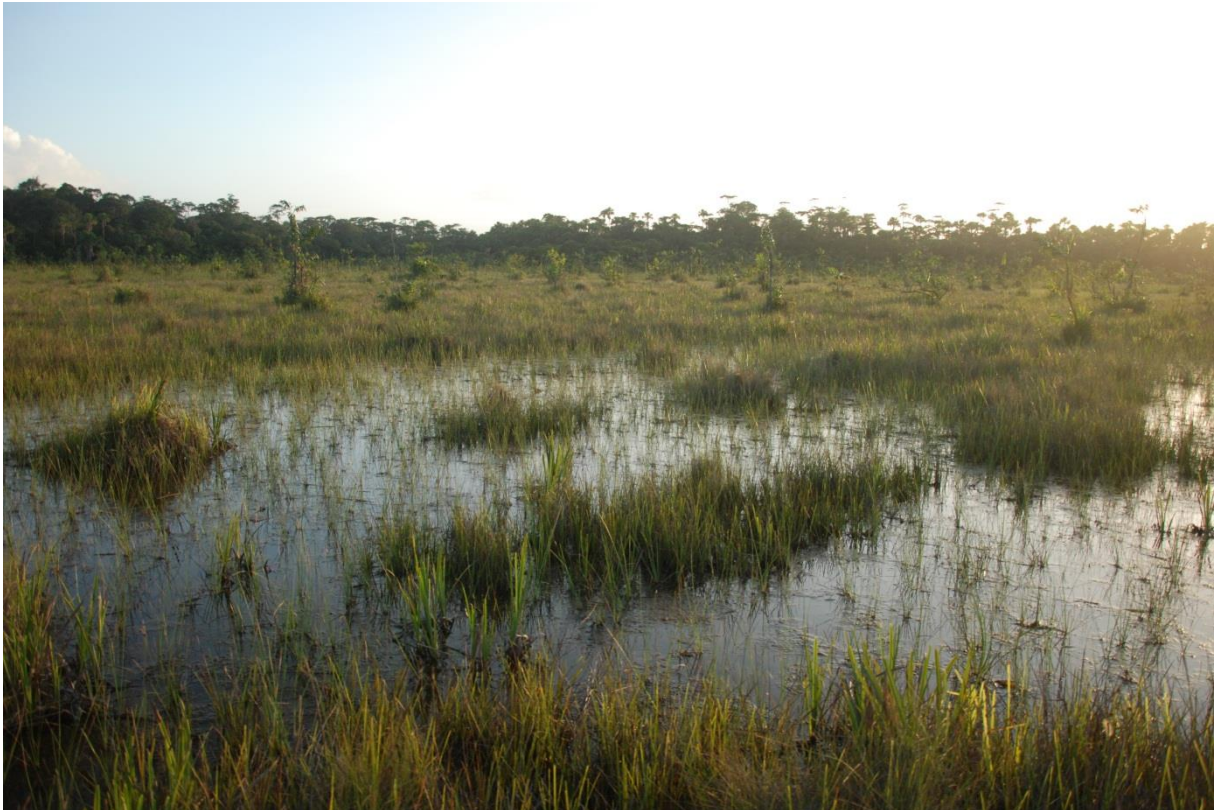
Dépression temporaire au Coeur de la saison des pluies. Cet exemple illustre les relations parfois étroites qui unissent bas-fonds et mares. L'absence de ceinture de végétation bien différenciée et l'absence de forme circulaire plaide pour la classification de cet habitat au sein des bas-fonds à buttes. Nancibo, avril 2011.