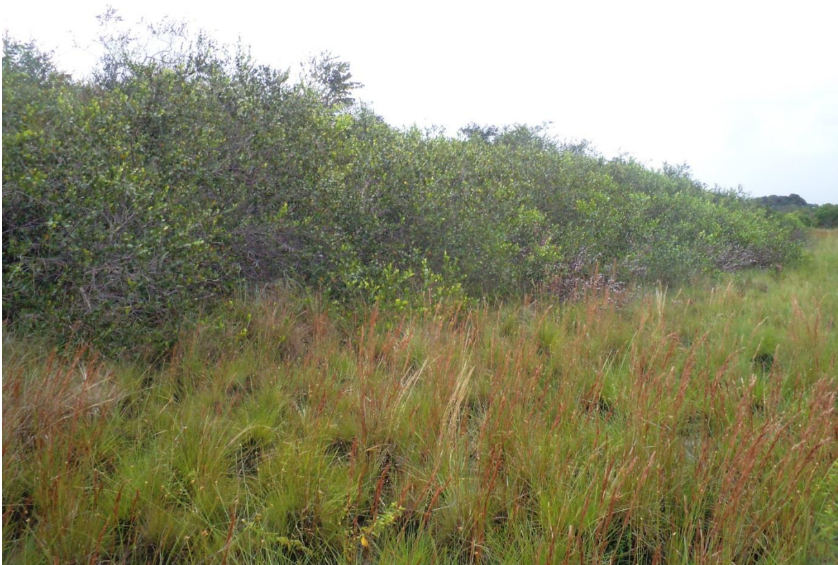
Aspect typique des fourrés à Chrysobalanus icaco . Au premier plan, un bas-fond à buttes (2.2) ceinture le bosquet. Brigandin, janvier 2012.

Description : formation arbustive basse, se présentant sous forme de fourrés denses, de 4-7 m de haut, sur sol marécageux, dominés par Chrysobalanus icaco . La strate inférieure est ombragée, composée essentiellement de grandes herbes (cyperaceae, poaceae) poussant les pieds dans l'eau. L'hygrométrie très importante du sous-bois favorise une flore épiphyte assez variée. Localement la dominance du Chrysobalanus peut être effacée par Pterocarpus officinalis ou par des Myrtaceae (typiquement Eugenia chrysophylla ou Myrcia pyrifolia ).