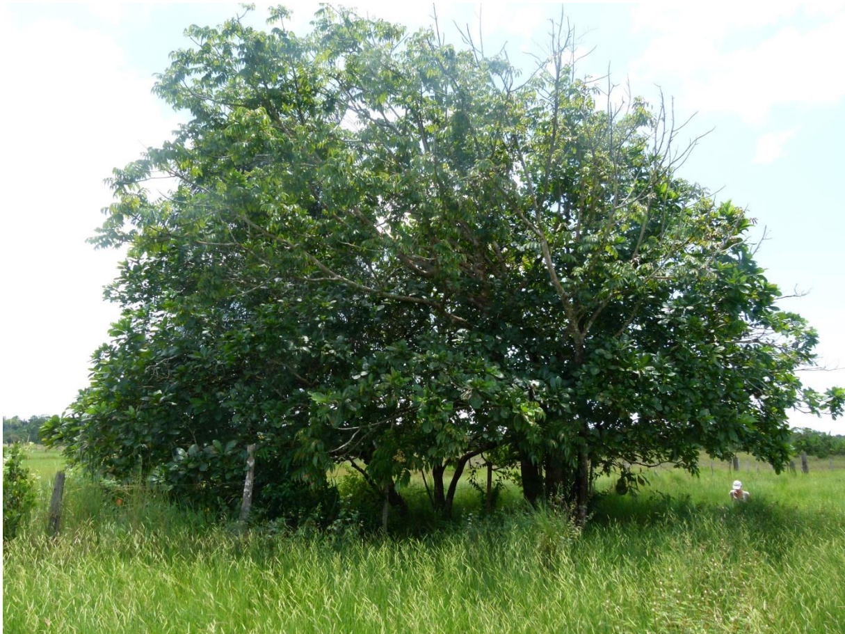
Pâturage à Kikouyou installé sur une ancienne savane sur sol hydromorphe. Matiti, août 2011.