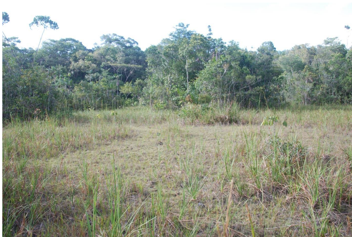
Savane temporairement inondable sur sables blancs. Notez la mosaïque d'habitat et notamment l'opposition entre les pelouses rases (3.2.1.1) au centre et les savanes à Panicum nervosum (3.2.2.2) sur les marges. Savanes incluses de Nancibo, septembre 2011.