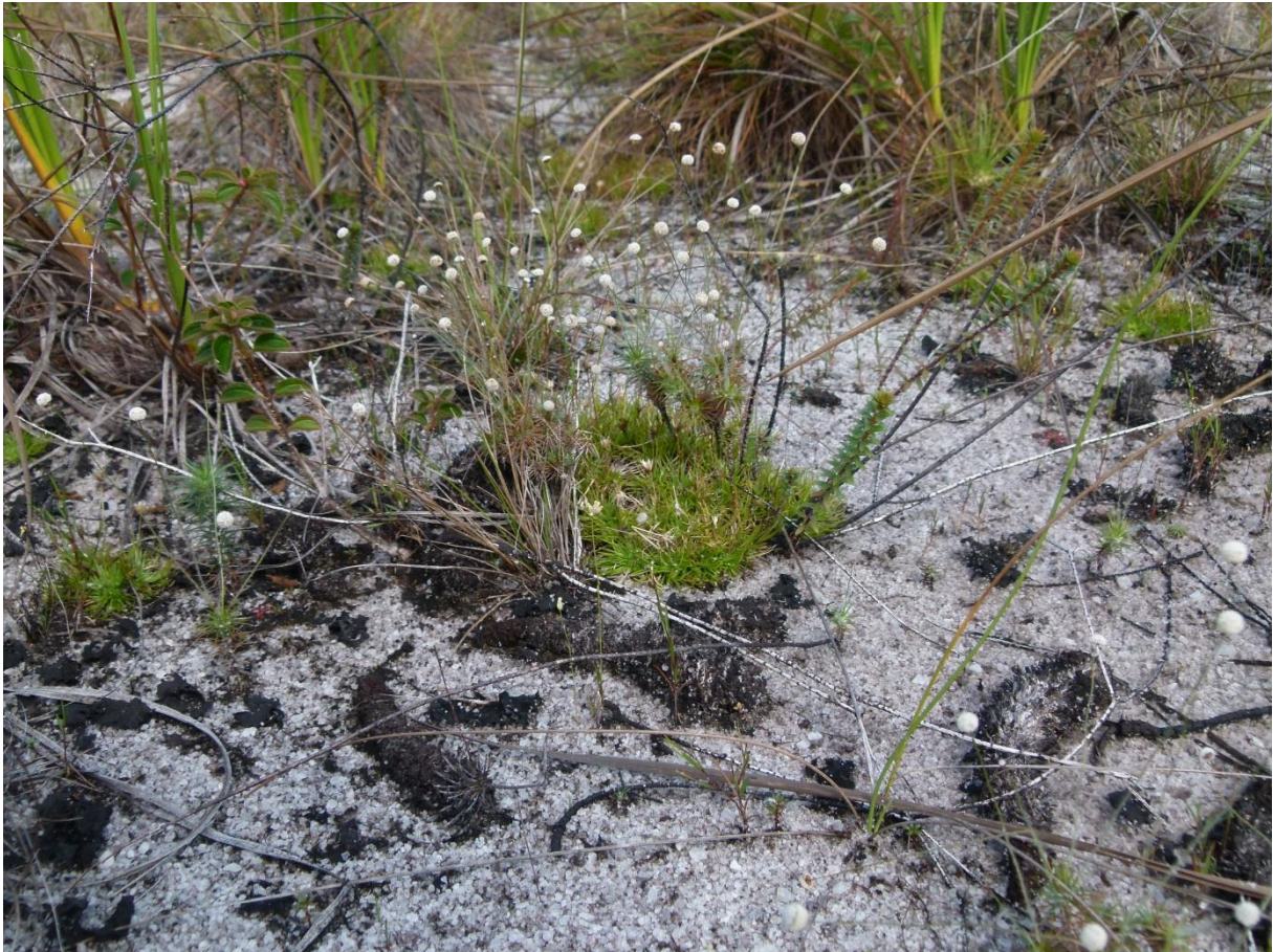
Florule des affleurements de sables blancs, où l'on distingue: Lagenocarpus sabanensis (Cyperaceae), Bulbostylis lanata (Cyperaceae), Abolboda americana (Xyridaceae), Comolia villosa (Melastomataceae), Sauvagesia sprengelii (Ochnaceae) ainsi que les petites inflorescences sphériques d'un Paepalanthus nouveau pour la Science (Eriocaulaceae). Terres Blanches, juillet 2011.