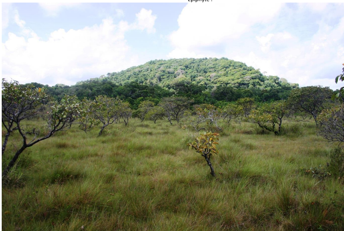
Savane moyennement haute sur sol hydromorphe, parsemée de petits arbres tortueux ( Byrsonima crassifolia ) poussant sur de petites buttes (3.1.3). Savane des Pères de Kourou, août 2011.

Description : formation herbacée dense, de hauteur moyenne (ca. 50 cm), se développant sur sols hydromorphes. Le sol est plan mais on remarquera souvent la présence de touradons de Rhynchospora globosa peu marqués. La végétation est très largement dominée par des cypéracées et des graminées ; les dicotylédones sont rares et éparées. Bien qu'occupant de vastes surfaces elle est souvent intégrée à une mosaïque d'habitats imbriqués et est ainsi presque toujours associée aux pelouses rases sur sols hydromorphes (3.2.2.1) et parsemée de buttes exondées (3.1.3).