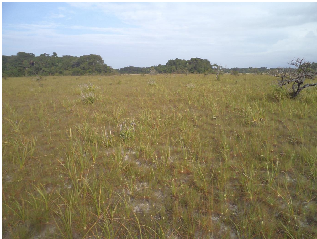
Un exemple moins extrême que le précédent. Trou-Poisson, décembre 2011.

Liens avec les autres habitats : la position extrême qu’occupe cette formation végétale sur l’AFC souligne sa singularité. Nous avons déjà noté sa diversité intrinsèque. A un extrême on trouve les formations les plus xériques sur sables affleurants très purs, à un autre des formations intermédiaires avec les pelouses rases sur sols hydromorphes (3.2.2.1) d’une part, avec les savanes sèches à Scleria cyperina (3.1.2) d’autre part.