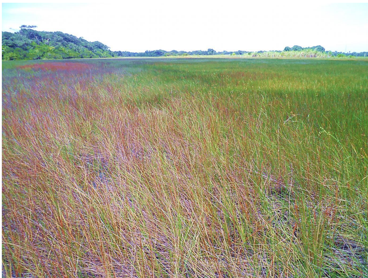
Pripris à Eleocharis interstincta . Trou-Poisson, décembre 2011.