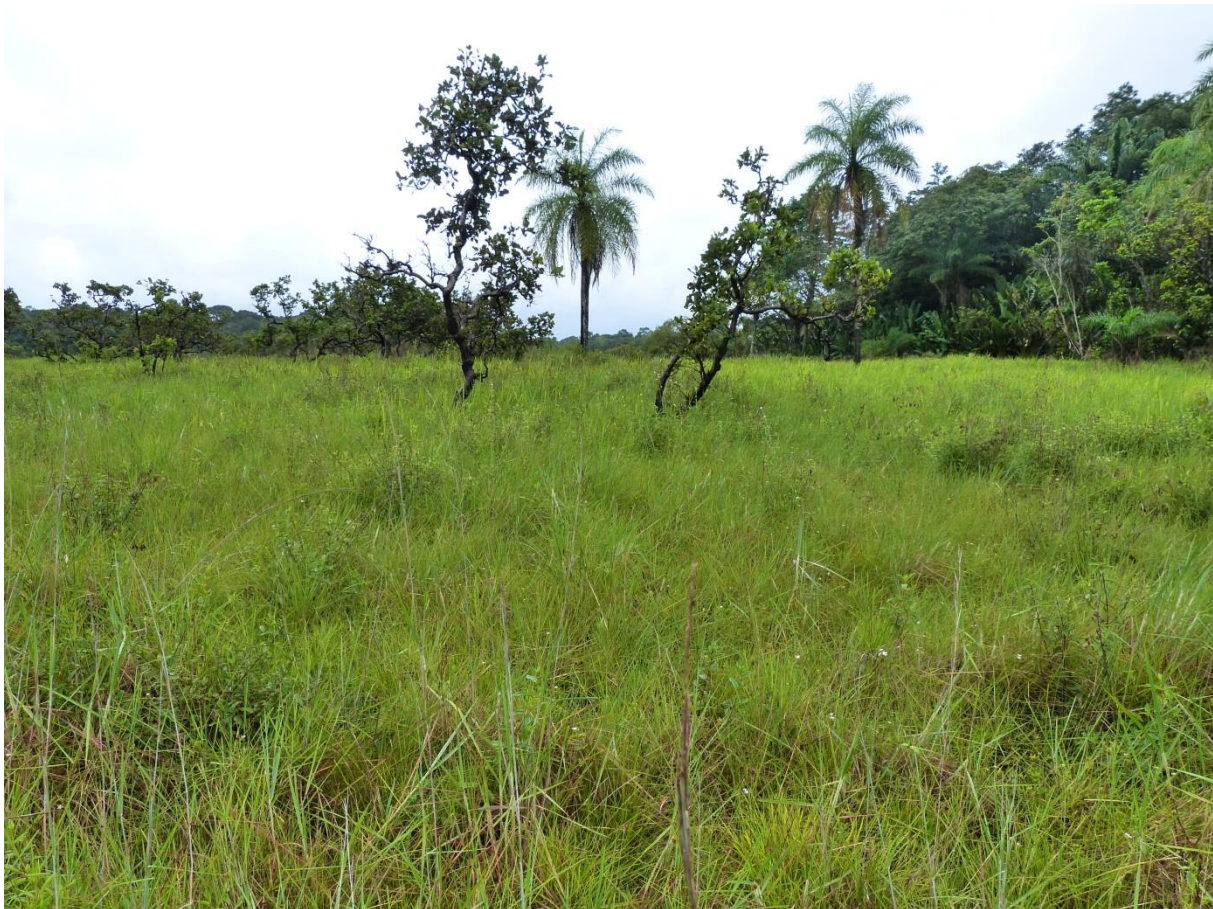
Savane sèche établie sur sables grossier de chenier colonisant le sommet d'une colline. Cette zone, se signalant de loin par la présence des deux grands palmiers Moucaya ( Acrocomia aculeata ), a permis une série de découvertes botaniques du plus grand intérêt. Savane Garré-Rocheau, avril 2012.