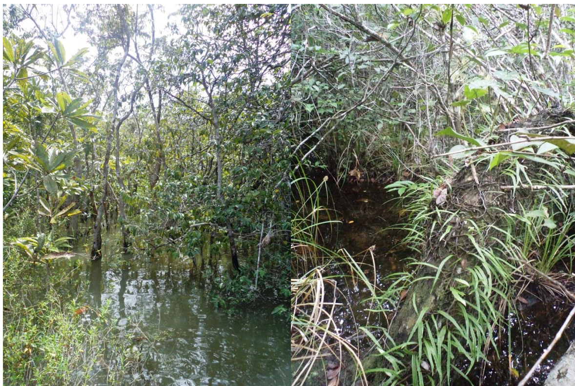
Sous-bois des petits bosquets de savanes marécageuses. Notez le sol largement inondé dès le début de la saison des pluies et l'abondance des épiphytes. a) Corossouy, janvier 2012 ; b) Brigandín, janvier 2012.