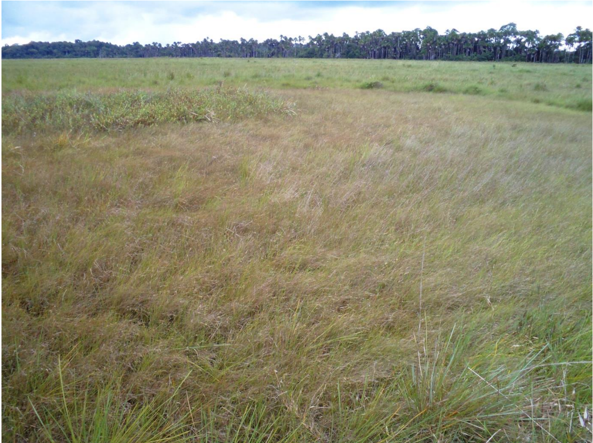
Observer les anneaux concentriques définissant plusieurs unités de végétations autour de cette mare naturelle de savane sur sables blancs. Trou-Poisson, décembre 2011.