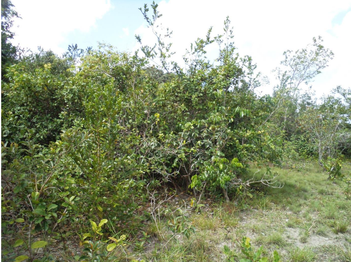
Formation arborée sur sol drainé de sommet de chenier. Notez la taille intermédiaire entre îlot forestiers et petit bosquet. Canceler, décembre 2012.