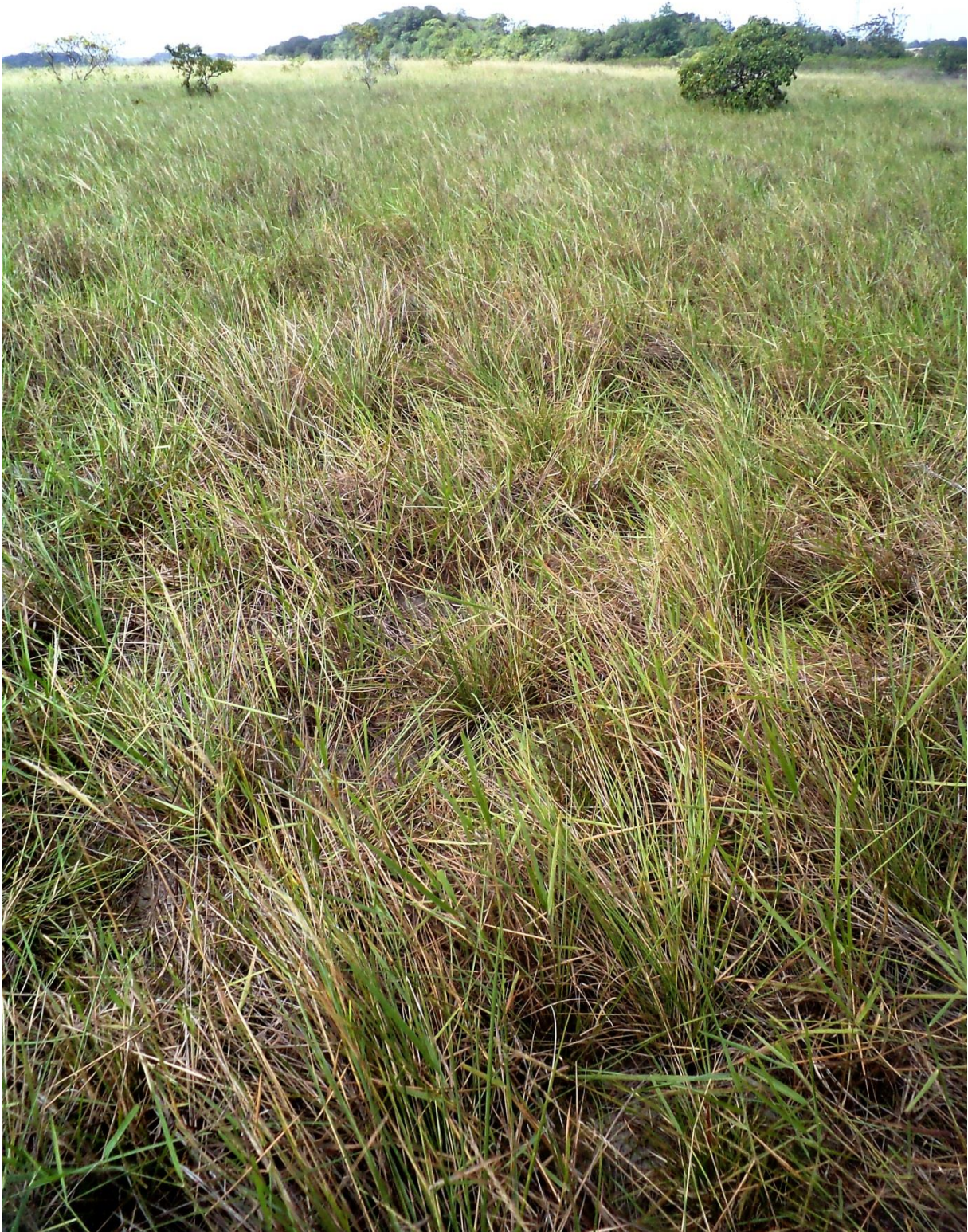
Savane sèche à Trachypogon , Corosony, décembre 2011.