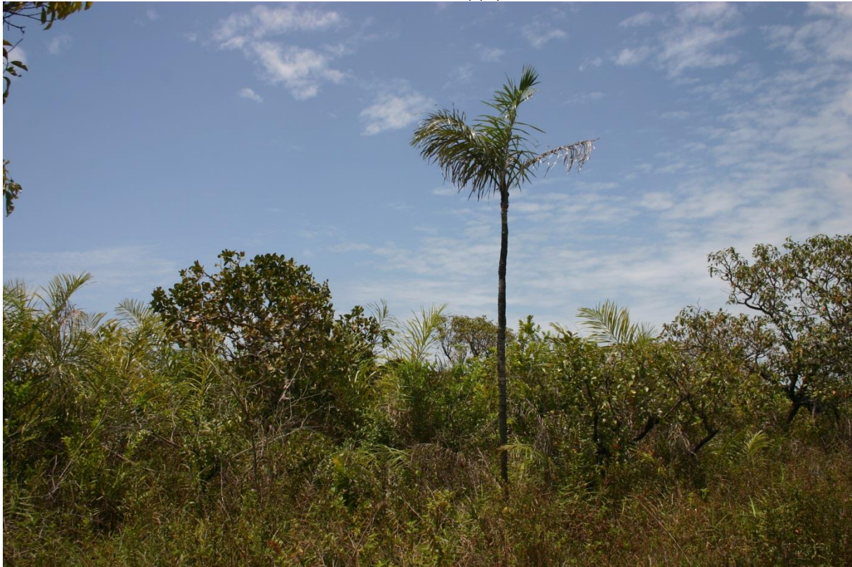
Petit bosquet typique de savanes sèches. Notez la dominance des palmiers épineux ( Astrocaryum vulgare ). Savane des Pères de Kourou, août 2011.

Description : petits bosquets de savane, de faible hauteur (< 8 m), se développant en savane sèche et généralement sur les sols drainés des sommets de colline. Ils sont généralement de superficie limitée. La strate inférieure est composée d'herbes héliophiles ou hémisciaphiles, dénotant l'absence de vrai sous-bois. On observe parfois un modelé du sol qui conduit dans certains cas à la formation de systèmes buttes-chenaux diversifiant significativement la flore.