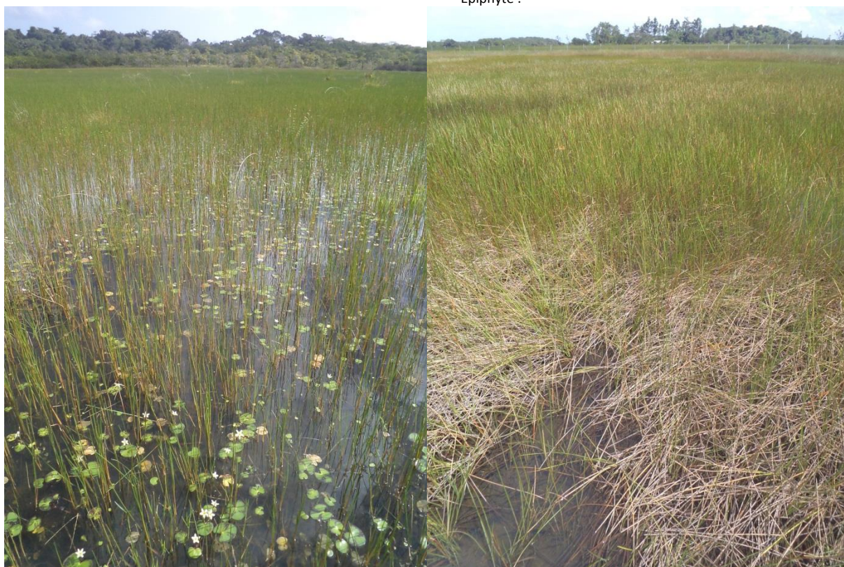
Deux aspects des pripris à Eleocharis interstincta . a) Canceled, on aperçoit les nombreuses fleurs blanches de Nymphoides indica ; b) Trou-poisson.

Description : formation marécageuse d'eau douce extrêmement caractéristique, hyper-dominée par une espèce de Scirpe, Eleocharis interstincta . Cette formation est en eau toute l'année y compris au creux de la saison sèche et la hauteur d'eau varie de quelques centimètres sur les bords à environ 70 cm (au-delà le couvert végétal ne comprend que des plantes aquatiques).