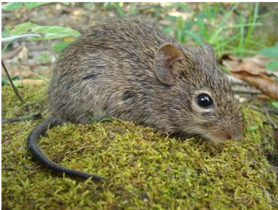
Figure 2 : Le Rat des savanes d'Alston ( Sigmodon alstoni ) est une des espèces caractéristiques des savanes du Plateau des Guyanes. image prise dans l'Amapa brésilien.